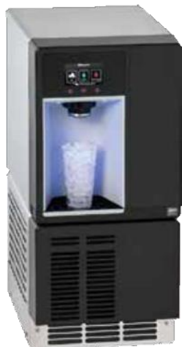
Οθόνη αφής 4,3" με διανομή χωρίς άγγιγμα